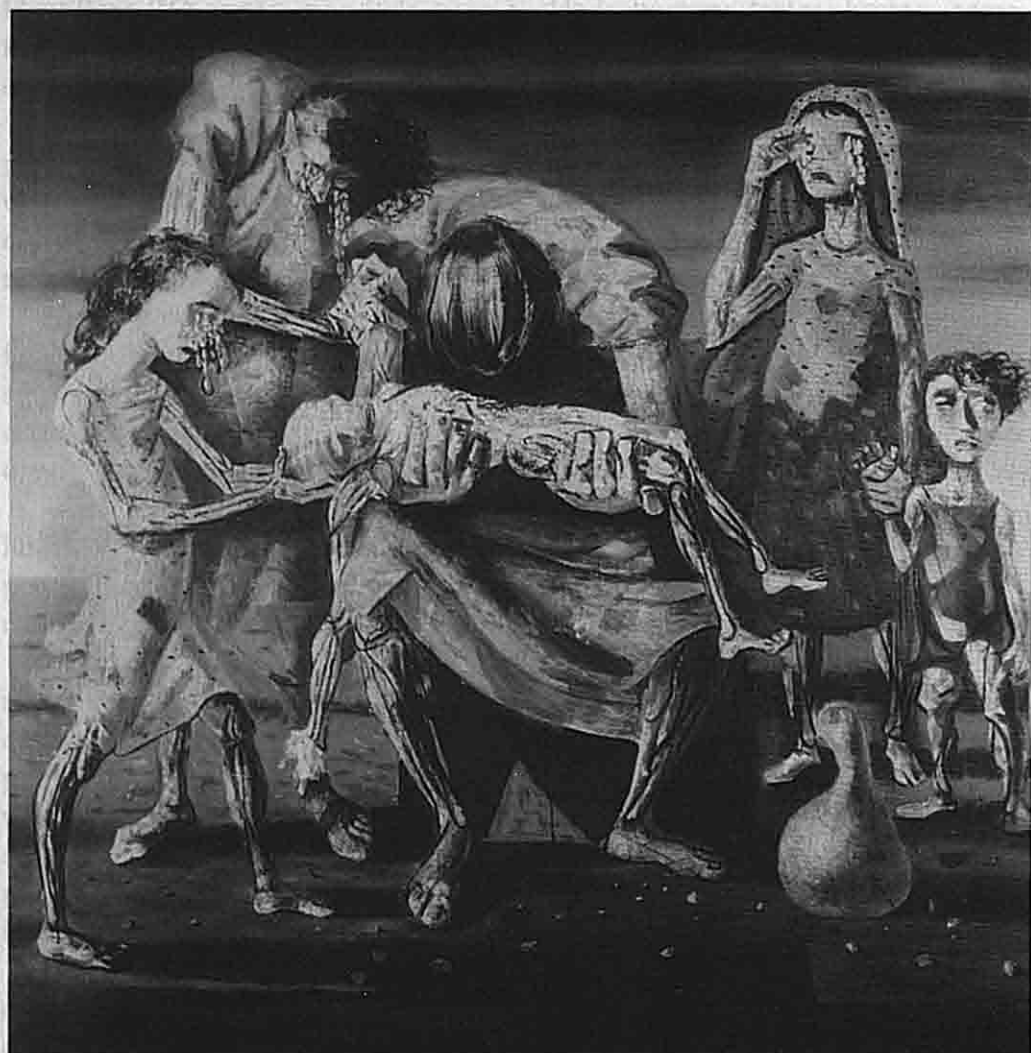
Cândido Portinari – Criança Morta , 1944.