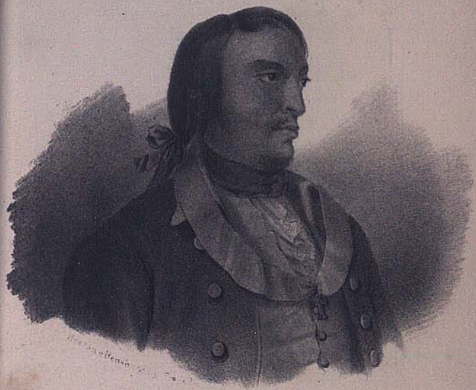
D. ANT. FELIPPE CAMARÃO GOVERNADOR DOS INDIOS NA PROVINCIA DE PERNAMBUCO.