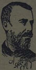
Couto de Magalhães